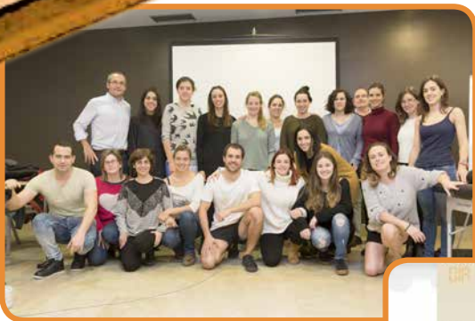
Terapia Manual y Técnicas de Punción Seca en el Tratamiento de los Punto Gatillo Miofasciales