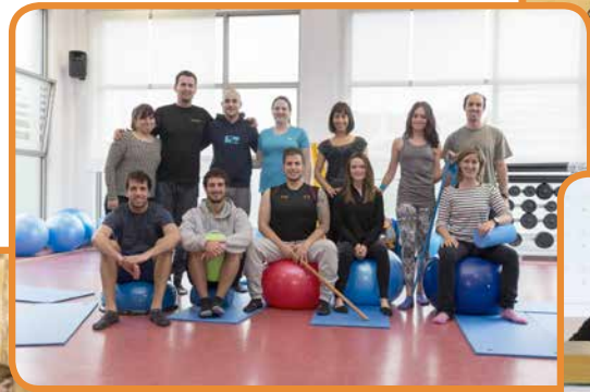
Escuela de Espalda