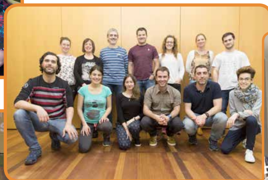
Prescripción Eficiente Ejercicio Físico Terapéutico