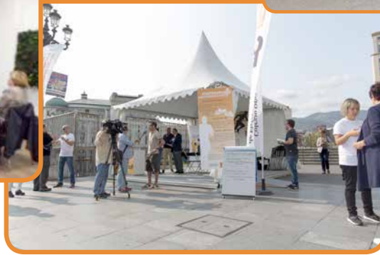
Día de la Fisioterapia en Bilbao