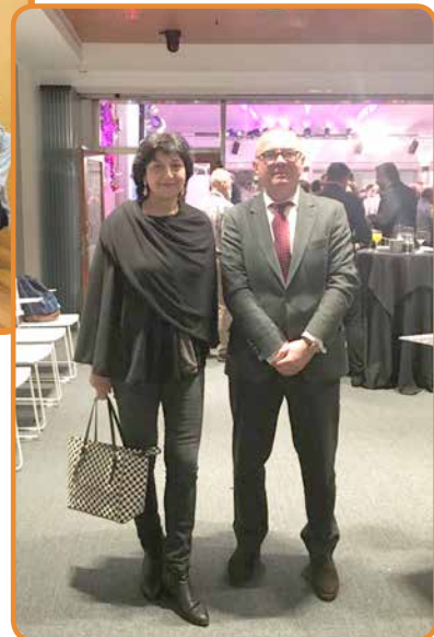
Recepción representantes Sociedad Vasca en Lehendakaritzza