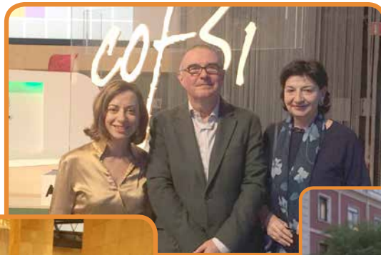
Evento del Colegio Farmacéuticos de Bizkaia