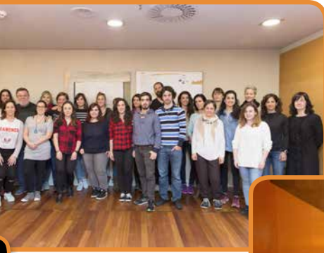
Inducción Miofascial Nivel I