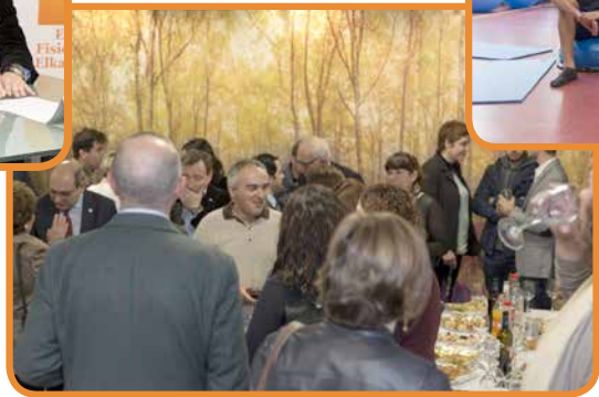
Inauguración Sede Colegial