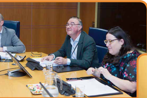
Comparecencia Parlamento Vasco