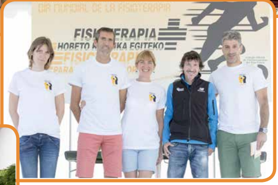
Día de la Fisioterapia en San Sebastián