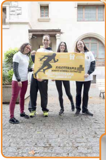
Día de la Fisioterapia en Vitoria - Gasteiz