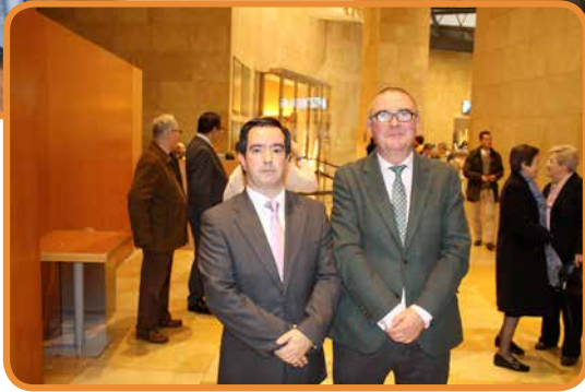
25 Aniversario Aita Menni