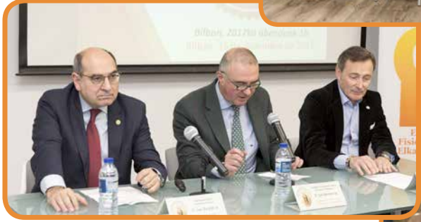
III Premios Euskadi de Fisioterapia