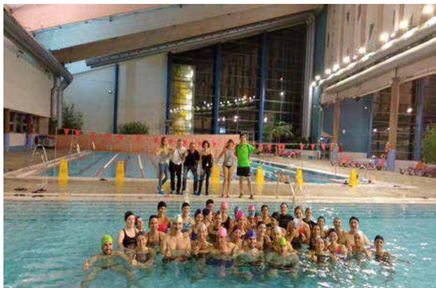
Masterclass el día sábado en la piscina, para todos los asistentes al congreso, a modo de cierre y despedida.

Desde esta Comisión nos hemos ofrecido para participar en las acciones de la Cátedra y en la elaboración de las Guías de Deporte Inclusivo en la Escuela, donde se detallan las adaptaciones de las actividades para el alumnado con discapacidad.