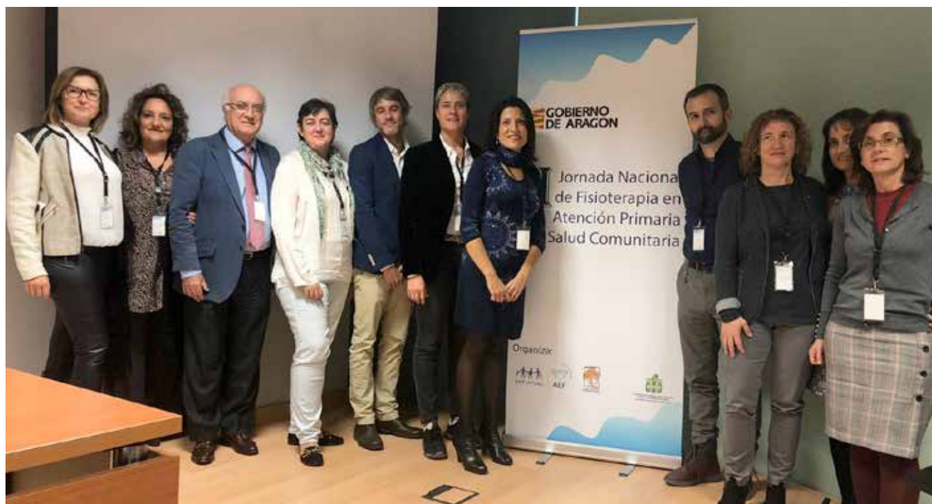
Distinta representación de Colegios Profesionales (Euskadi, Cataluña, Madrid, Navarra, Aragón, Castilla y León)